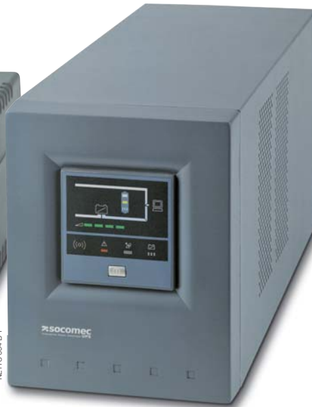
NETYS PE 1000 ВА